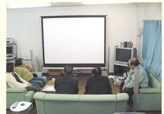
・映画研究会は、活動室のホームシアターを使い、大迫力の画面と臨場感のあるサウンドを体験できます

お気軽にお立ち寄りください。 皆様のご参加をお待ちしております。 連絡先 0178-70-2088