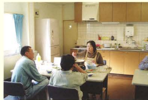
・セルフヘルプ例会は、利用者のグループ活動(話し合い、レクリエーション、行事、講座、他)を行う場の提供をしています。

※センターでは、1月1日～3日、「初詣ツアー」や「お正月映画上映会」、「お雑煮やなべを囲む会」「羽子板や福笑い大会」などを行っております。ぜひ一緒に「日本のお正月」を満喫しましょう。