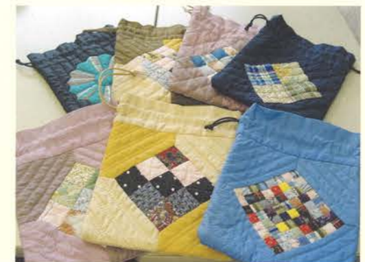
・手芸は、今までに「季節の花を利用した押し花」や「パッチワークの小物」などの作成をしました。